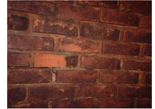
煙突壁面 除染作業後