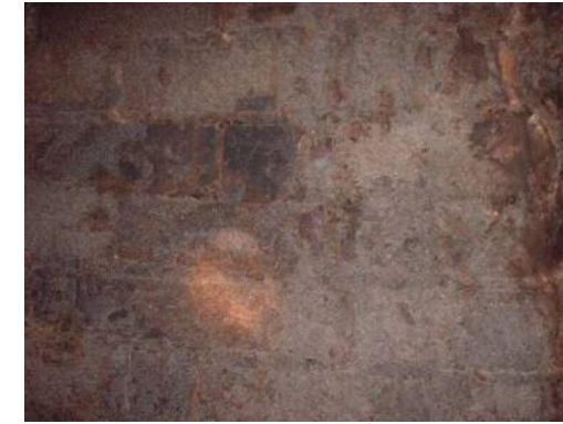
煙突壁面 除染作業前